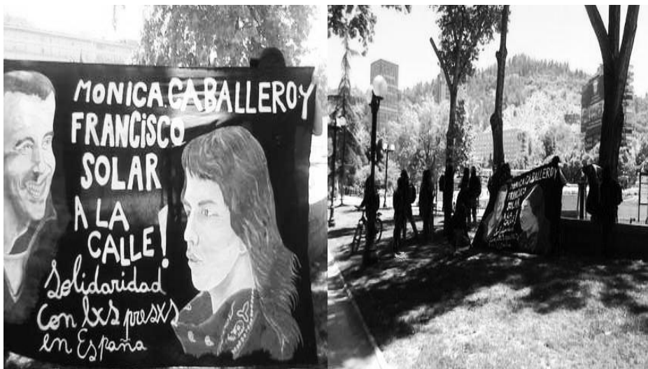
(Mitin solidario en las afueras de la Embajada de España en Chile. Diciembre 2013)

Cómo se ha estado expresando dicha ofensiva del poder, es lo que nos interesa analizar. Por supuesto que partimos del hecho de que del enemigo no esperamos más que su hostilidad y represión. Por eso las siguientes reflexiones apuntan en el sentido de aportar al análisis para reflexionar/entender el momento y pasar a la acción desde la perspectiva insurrecta de la ofensiva antiautoritaria contra el poder.