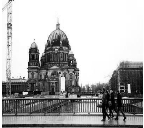
(Solidaridad con l@s 5 anarquistas en Barcelona. Lienzo colgado en Catedral de Berlín, Alemania)