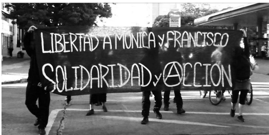
(Mitin en las afueras de la embajada de España en Uruguay. Diciembre 2013)

Diciembre 2013/sinbanderas.nifronteras@riseup.net