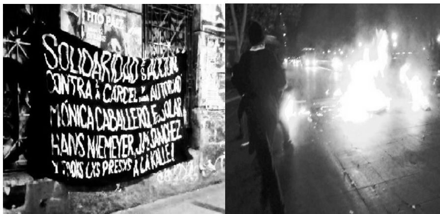
(Barricadas y propaganda en "La Alameda", principal avenida de Santiago, Chile. Diciembre 2013)